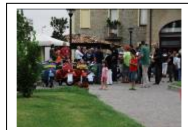
Nella sede del club per il raduno