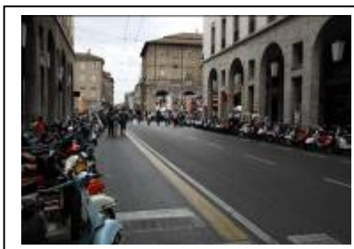
La parata in centro a Parma