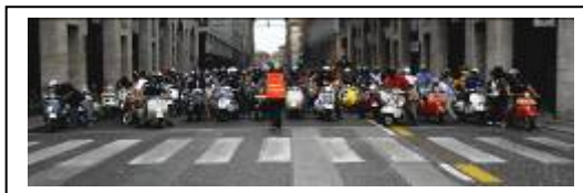
Giro per le vie del centro