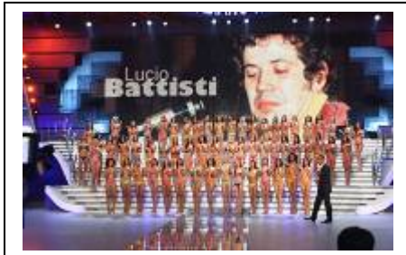
Le finaliste in costume da bagno